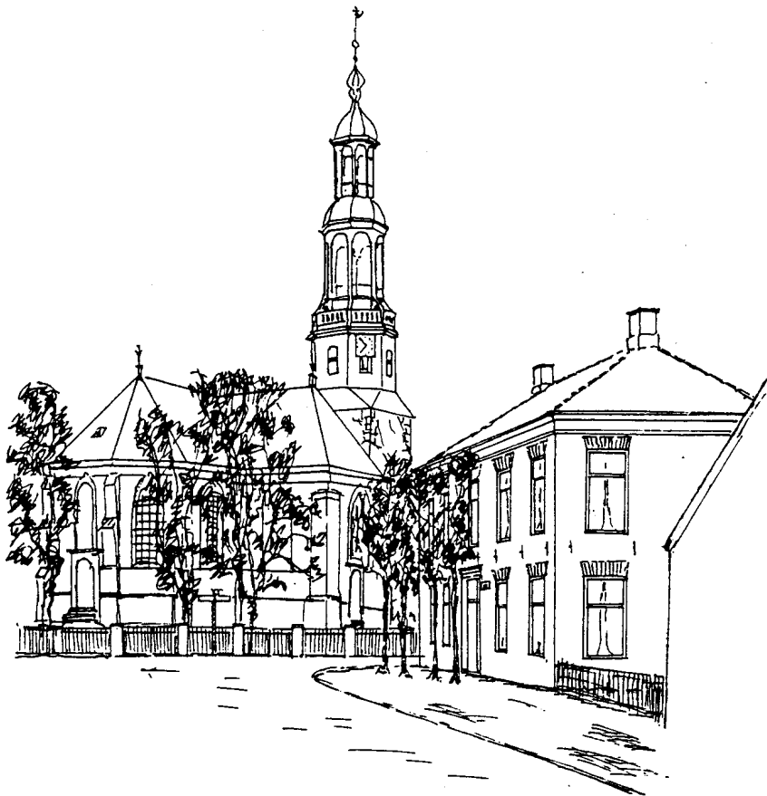
De toren van Uithuizermeeden met rechts café "De Koppelpaarden"